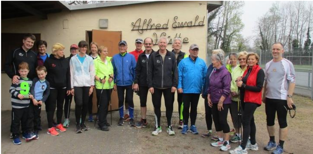
(Vor dem Start zum „Run up 2019“ – Fotograf Gerhard Paulus lief auch noch mit)