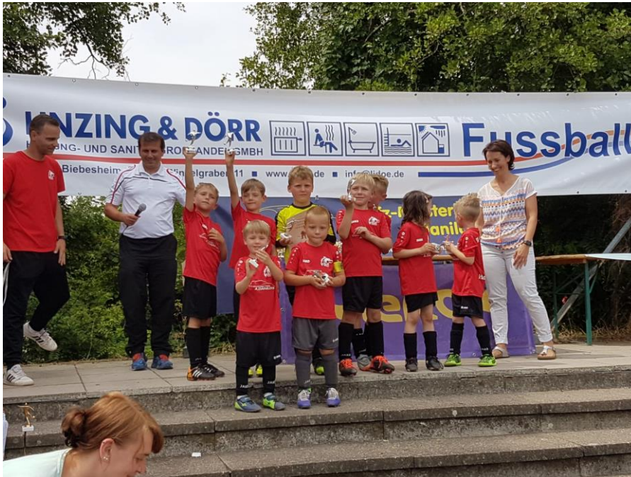
(Unsere G- Jugend belegte einen tollen 2 Platz)

Fußball * Karate * Leichtathletik * Ski * Tischtennis * Turnen * Volleyball