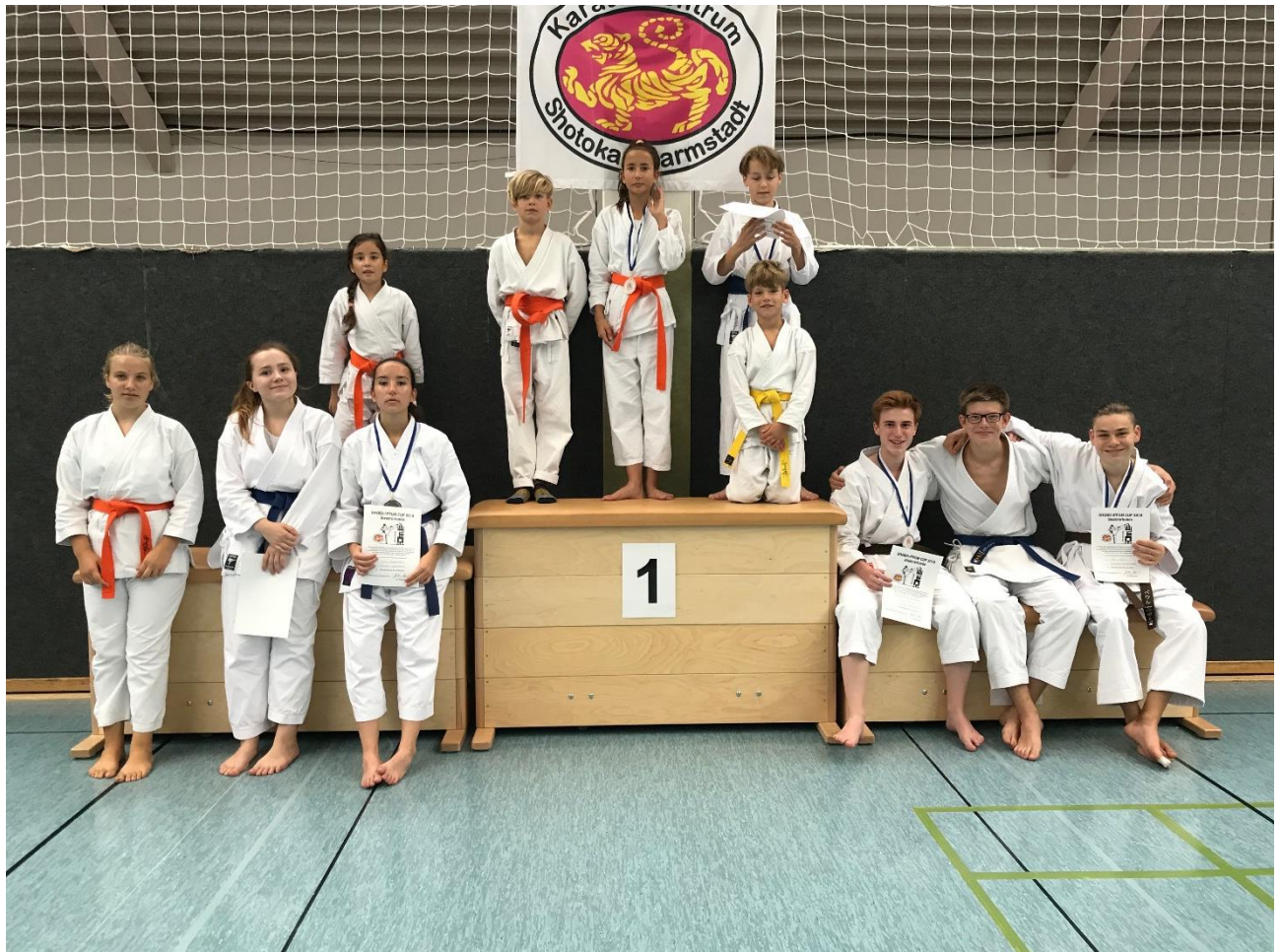
(ein Teil der erfolgreichen Wettkämpfer unseres Dojos)